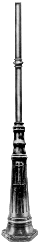
4856-1 Aluminio y caño 2,5" x 2500