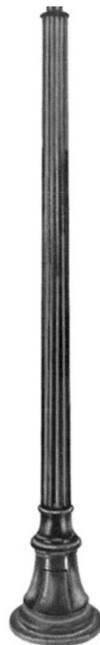
4186 Aluminio 4" x 2200